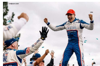
Alex Palou, la victoire et le titre 2023 assuré avant la finale