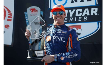
Colton Herta (P1) – Christian Lundgaard (P2) – Felix Rosenqvist (Pole) – Scott Dixon (Vainqueur)