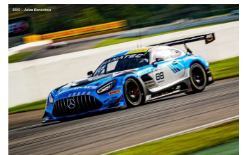
T. Boguslavskiy / R. Marciello

Engagés : 41 – Q2 : 41 – Partants : 41 – Classés : 34 – DISQ : 1 (# 66).