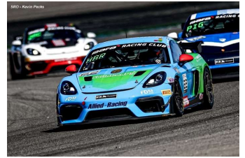
N. Schaap / A. Hartvig ( Silver )