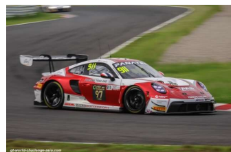
V. Inthraphuvasak / K. Bachler

Engagés : 36 – Qualifications : 36 – Partants : 34 – Classés : 33.