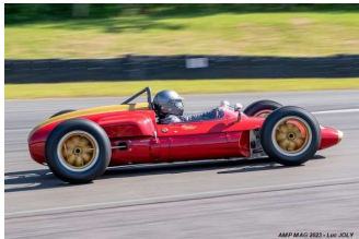
Grand Prix de l'Âge d'Or Dijon 2023