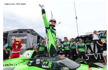
Christian Lundgaard en pole et vainqueur

Tours 46 à 50 : Contact Castroneves et Kirkwood (Virage 11).