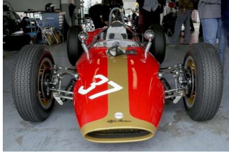
Grand Prix de France Historic Nevers Magny-Cours 2017

Les Redmond a une longue histoire dans la conception et la construction de voitures telles que les voitures Gemini Formula Junior construites par Chequered Flag Engineering (Londres).