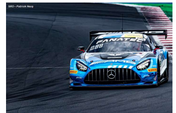
T. Boguslavskiy / R. Marciello

Engagés : 42 – Q1 : 42 – Partants : 42 – Classés : 37.