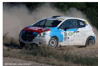
L. Astier / L. Declerck J. Pontal / L. Bagetti