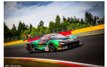
Start race – Top 5 pour BMW (Rowe Racing), top 7 pour Porsche (KCMG) et top 8 pour McLaren (JOTA)