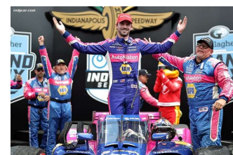
Alexander Rossi vainqueur

Tours 3 et 4 : Sortie Dalton Kellett (Turn 7) Tours 36 à 38 : Sortie Simon Pagenaud (Turn 10).