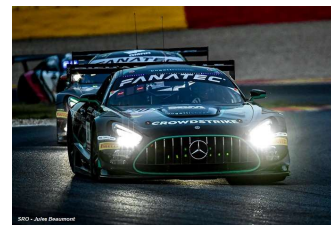
Team WRT vainqueur Silver Cup – Iron Dames vainquer Gold – AF Corse vainqueur ProAm – SPS Automotive Performance vainqueur Bronze