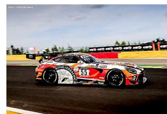
Le quarté final : Akkodis ASP Team, AMG-Team GetSpeed, Iron Lynx et AMG-Team Gruppe M Racing