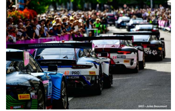
La traditionnelle parade, passé et présent, dans les rues de Spa