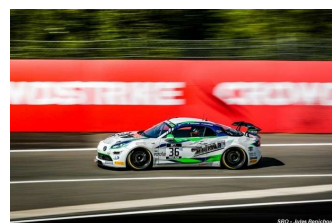
A. Leclerc / L. Villiger

Engagés : 55. Q1 : 53 (55). Partants : 53. Classés : 46.