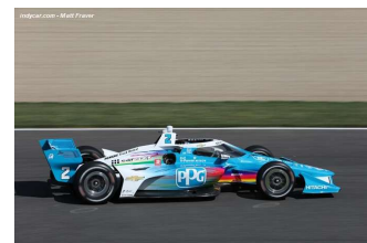
Felix Rosenqvist en pole à Indy – Top 3 pour Will Power – Top 5 pour Josef Newgarden