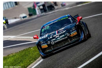
S. Tirman / P. Sancinena

Top chrono Am pour l'Audi R8 LMS GT4 Saintéloc Racing # 27 ( Faessel ) en 2'32"137.