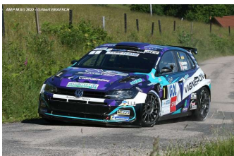
Giordano / Parent

Tous les résultats sur https://www.pksoft.fr