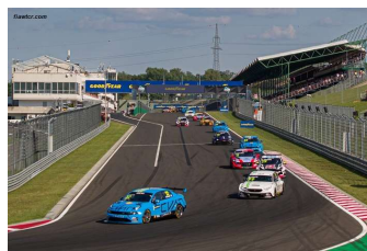
Top 3 pole (Berton, Azcona et Ehrlacher) – Deux top cinq pour Qinghua Ma (Lynk & Co) – Race action