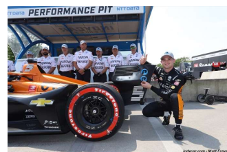
Patricio O'Ward en pole Marcus ERICSSON vainqueur

24 à 30 (Contact Felix Rosenqvist virage 6), 65 et 66 (Contact Romain Grosjean virage 9).