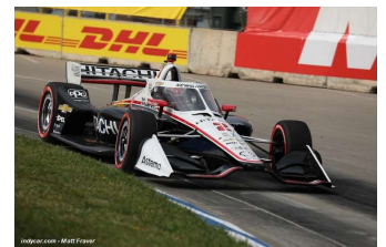
Josef Newgarden, deux tours en trop...