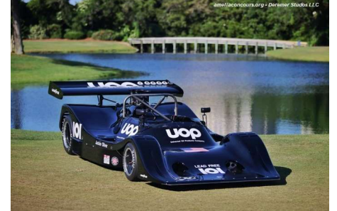
Best in Show 2021 : l'Hispano-Suiza H6B Cabriolet 1926 (Élégance) et la Shadow DN4 1974 (Sport)