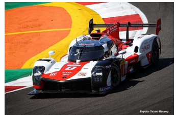
Toyota Gazoo Racing bis

Prochain rendez-vous : 6 HEURES de MONZA les 17 et 18 juillet