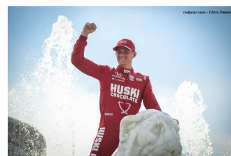
Première pour le pilote Suédois