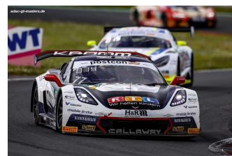
J. Schmidt / M.Kirchhöfer