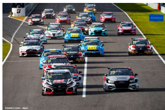
Départ course 1