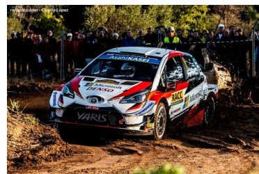
Tänak / Järveoja Champions 2019