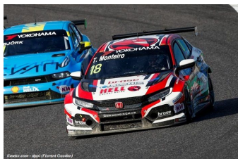
Tiago Monteiro (Honda)