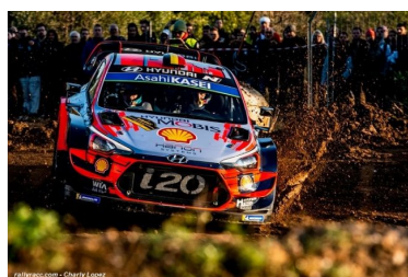
Day 2 : Neuville / Gilsoul en tête

Neuville s'imposait dans les deux premières spéciales avant de laisser la vedette à Tänak qui imposait sa loi dans les quatre spéciales suivantes. Le Belge reprenait l'avantage dans la dernière spéciale confortant sa première place. Sordo conservait la seconde place devant Tänak venu à bout de Loeb pour 0"6. Ogier réapparaissait dans le top dix mais bien loin des leaders. En WRC2, Østberg menait toujours les débats en Pro devant Kopecky et Rovnanperä. Camilli précédait Loubet et Kajetanowicz.