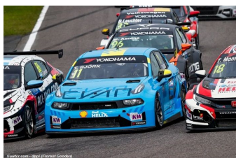
Thed Björk (Lynk & Co)