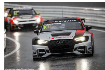
Niels Langeveld (Audi)