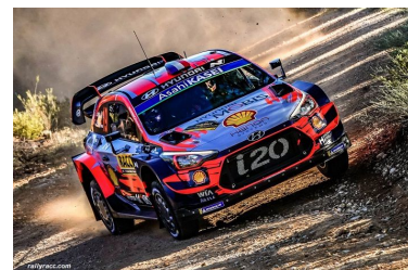
Day 1 – Loeb / Elena leaders

26-10 (7 spéciales) : NEUVILLE devant SORDO et TÄNAK, ØSTBERG et CAMILLI leaders WRC2-PRO et WRC2