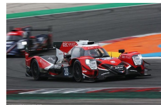
Victoire et titre pour IDEC Sport

Engagés : 39 – Qualifications : 37 (39) – Partants : 39 – Classés : 31.