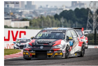
Johan Kristoffersson (VW)

Course terminée sous safety-car. Seconde victoire dans la série pour Johan Kristoffersson qui partait de la pole. Débordé au départ par Tiago Monteiro, il reprenait rapidement l'avantage avant de filer vers la victoire. Derrière, Tiago Monteiro cédait la seconde place à Esteban Guerrieri puis se voyait débordé par Kevin Ceccon pour la troisième place. Les pénalités vont tomber rapidement et Thed Björk héritait de la troisième place précédant Gabriele Tarquini, Andy Priaulx, Kevin Ceccon, Robert Huff et Norbert Michelisz. Tiago Monteiro initialement quatrième se voyait repoussé à la quinzième place. Esteban Guerrieri reprenait la tête du Championnat.