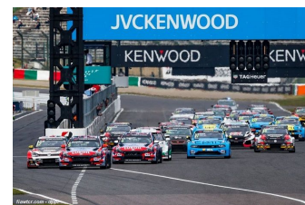
Départ course 2

Norbert Michelisz s'impose sur cette seconde course. Parti de la pole le Hongrois défendra sa place de manière assez musclée face à son voisin de grille Robert Huff. Ce dernier restera cependant son plus sérieux adversaire pendant toute la course sans parvenir à ses fins. Gabriele Tarquini prenait la troisième place après avoir résisté toute la course à la pression de Kevin Ceccon. Thed Björk se classait juste derrière devant Tiago Monteiro, Johan Kristoffersson, Mikel Azcona, Jean-Karl Vernay et Esteban Guerrieri. À l'issue de cette seconde course, Norbert Michelisz reprenait la tête du Championnat avec six points d'avance sur Esteban Guerrieri.