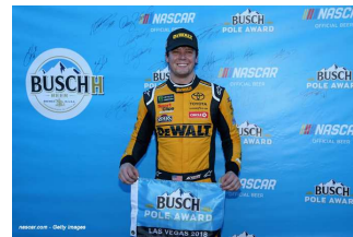
Joey Logano (P1), Ryan Newman (P2) et Erik Jones (P3) au top des libres – Erik Jones en pole position

LAS VEGAS : Joey Logano (28"473), Ryan Newman (29"365) et Erik Jones (29"793) seront les meilleurs des trois séances d'essais qui étaient au programme. Erik Jones s'adjugeait la pôle position en 28"705 devant Joey Logano et Denny Hamlin.