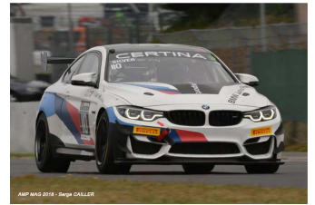
AMP MAG 2018 - Serge CALLER