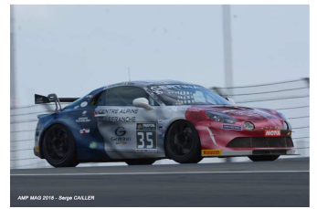
AMP MAG 2018 - Serge CALLER

44 voitures auront participé (NP # 75 et pas de chrono pour la KTM # 24 et pour la Porsche # 104).