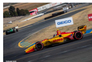
Scott DIXON Champion 2018