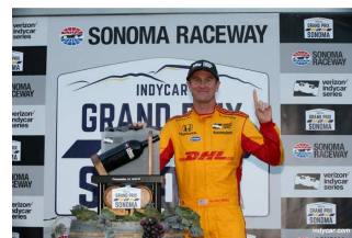
Ryan HUNTER-REAY Vainqueur à Sonoma

Meilleur temps en course : Scott Dixon en 1'19"8646 au 41 ème tour.