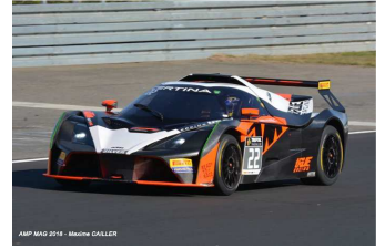
AMP MAG 2018 - Maxime CALLER