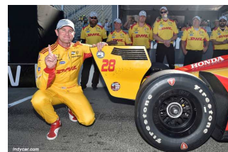
Ryan Hunter Reay (P1), Josef Newgarden (P2) et Scott Dixon (P3) au top des libres – Ryan Hunter Reay en pole position

ESSAIS LIBRES : Libres 1 : Top chrono pour Ryan Hunter-Reay (Andretti Autosport) en 1'17"5742 devant Scott Dixon (Chip Ganassi Racing) en 1'17"8268 et Will Power (Team Penske) en 1'17"8818. Libres 2 : Josef Newgarden (Team Penske) en 1'57"8156 devant Scott Dixon (Chip Ganassi Racing) en 1'17"8992 et Patricio O'Ward* (Harding Racing) en 1'18"0073. Libres 3 : Scott Dixon (Chip Ganassi Racing) en 1'17"9697 devant Will Power (Team Penske) en 1'17"9793 et Ryan Hunter-Reay (Andretti Autosport) en 1'18"1238.