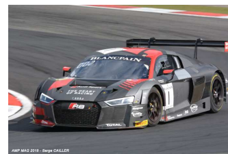
A. Riberas / C. Mies

Engagés : 20. Q1 : 20. Partants : 20. Classés : 17.