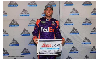
Kyle Busch (P1), Denny Hamlin (P2) et Martin Truex Junior (P3) au top des séances – La pole pour Denny Hamlin

Miami : Kyle Busch (31"269), Denny Hamlin (31"555) puis Martin Truex Junior (31"543) réalisaient les meilleurs chronos des trois séances d'essais qui étaient au programme. Denny Hamlin s'adjugeait la pole en 31"038 devant Martin Truex Junior (31"043) et Kyle Busch (31"047). Kyle Larson avait dominé les quatre prétendants au titre lors des deux premiers segments de la course. Martin Truex Junior fort discret en début de course s'est alors montré beaucoup plus incisif et a pris les commandes de la course devant Kyle Busch qui tentera jusqu'au dernier tour le le déloger de la première place mais Martin Truex Junior était le plus fort et s'adjuge son huitième succès de la saison synonyme de premier titre dans la série majeure de la Nascar. Un titre grandement mérité tellement le pilote de la Toyota # 78 aura dominé la saison 2017. Kyle Busch, Kyle Larson, Kevin Harvick et Chase Elliott complètent le top cinq de cette dernière course de l'année. Clap de fin pour Dale Earnhardt Junior mais aussi pour Danica Patrick qui disputera la Daytona 500 et l'Indy 500 en 2018 avant de mettre fin à sa carrière.