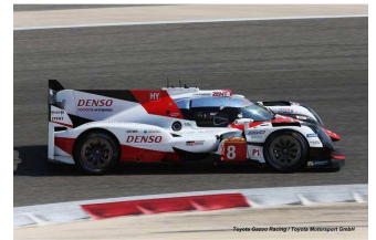
La dernière à Toyota...*

Engagés : 26 – Libres : 26 (26-26-26) – Qualifications : 25 – Partants : 26 – Classés : 25.