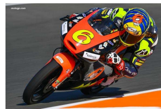
Marc Marquez champion / Johann Zarco Rookie 2017 / Honda meilleur constructeur – Hommage à l'unique féminine en GP Maria Herrera