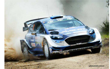
E3 : Tänak / Jarveoja seconds

Les positions au Championnat mondial après l'Australie (sous réserves) :