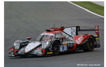
Porsche bat une nouvelle fois Toyota et tire sa révérence – Le Rebellion Racing finit par vaincre le Jackie Chan DC Racing

LMGTE : On prends les mêmes et on recommence, la venue de BMW en 2018 fera du bien à une catégorie ignorée par un grand nombre de constructeurs, demandez vous pourquoi !!