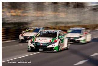
MAC 3 : HONDA facilement