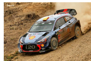
E1: Mikkelsen / Jaeger au top