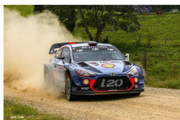
E2 : Neuville / Gilsoul devant