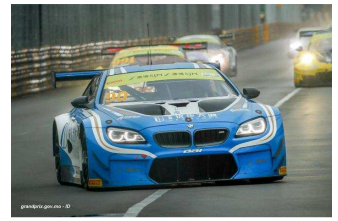
Start race 1 avant le crash – Augusto Farfus (BMW Schnitzer) – Raffaele Marciello (AMG Driving Academy) – Chaz Mostert (Fist Team AAI)

LIBRES : Top chrono pour Robin Frijns (Audi R8 LMS Audi Sport Team WRT # 1) en 2'18''507 (S2) devant Augusto Farfus (BMW M6 GT3 BMW Team Schnitzer) en 2'18''850 (S2) et Markus Pommer (Audi R8 LMS Aust Motorsport) en 2'18''879 (S2). Top cinq complété par Maro Engel (Mercedes-AMG GT3 AMG-Gruppe M # 999) en 2'18''948 (S1) et par Raffaele Marciello (Mercedes-AMG GT3 AMG-Gruppe M # 999) en 2'18''969 (S1). Tous les concurrents engagés auront participé à au moins une séance.