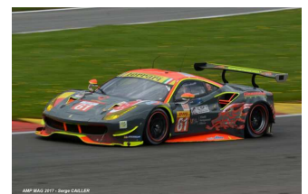
Pro : Un nouveau titre pour AF Corse devant le Ganassi Racing UK – Am : Aston Martin Racing logiquement devant le Clearwater Racing