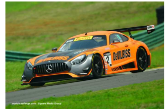
Dalziel / Morad (SprintX Pro)