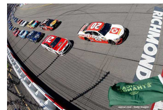
Fin 2017 Dale Junior tirera sa révérence – Martin Truex Junior (P1) – La pole pour Matt Kenseth – Start race

RICHMOND : Martin Truex Junior (21"783), Erik Jones (22"367) et Kyle Larson (22"675) seront les meilleurs des trois séances d'essais qui étaient au programme. Dans la foulée de la première séance, Matt Kenseth s'était adjugé la pôle position en 22"300 devant Ryan Blaney (22"341) et Martin Truex Junior (22"373). Parti du fond de la grille suite à un changement de transmission, Joey Logano a réussi à s'imposer à Richmond. Une première victoire cette année pour Joey Logano, Brad Keselowski complète le succès du Team Penske en prenant la seconde place, un week-end d'enfer après le doublé en Indycar pour Penske. Matt Kenseth aura dominé le premier segment, Brad Keselowski le second. Neuf neutralisations seront venues entraver la course surtout dans le dernier segment ou les teams auront tenté quelques paris plus ou moins réussis. Quatre gommes neuves pour Joey Logano et la messe était dite. Au championnat, Kyle Larson reste leader (398 pts) devant Martin Truex Junior (358 pts), Chase Elliott (346 pts), Joey Logano (333 pts) et Brad Keselowski (327 pts).