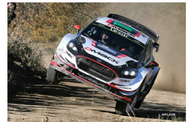
Evans / Barritt solides leaders

29/4 (6 spéciales) : EVANS toujours leader, NEUVILLE menaçant – TIDEMAND domine le WRC2