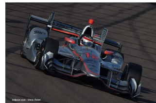
Ed Carpenter reprenait le volant – Tout pour le Team Penske, Helio Castroneves en pole et Simon Pagenaud vainqueur devant Will Power