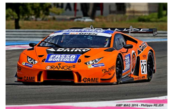
Biagi / Crestani

Engagés : 16 – Q2 : 16 – Partants : 16 – Classés : 15.