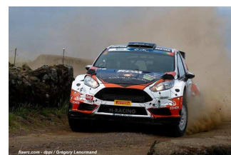
Lukyanuk / Arnautov