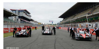
Mise en place pour une première photo de famille de l'édition 2016