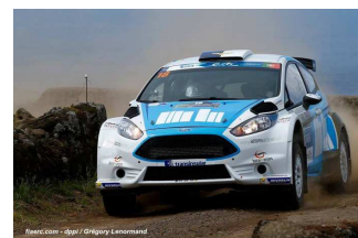
Moura / Costa