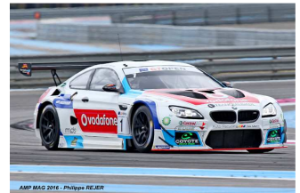
Ramos / Rodriguez

Engagés : 16 – Q1 : 15 – Partants : 16 – Classés : 15.