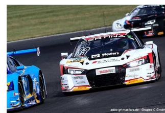
Grid girl – Départ seconde course – Peu à l'aise ici les Bentley du Team Abt – Frankenhout / Haase (Car Collection Motorsport)

PROCHAIN RENDEZ-VOUS : RED BULL RING du 22 au 24 juillet