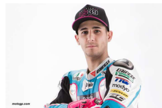
1991 / 2016

AMP MAG présente ses condoléances les plus sincères à sa famille et à ses amis.