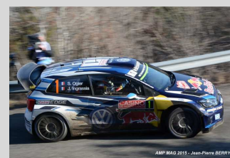
AMP MAG 2015 SPECIAL 010