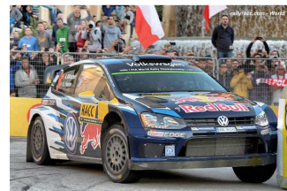
E3 : Mikkelsen / Floene vainqueurs.