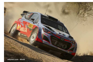
Photo de famille – Kubica / Szczepaniak (Ford) – Tänak / Molder (Ford M-Sport) – Neuville / Gilsoul (Hundai).

22 et 23 / 10 (1 + 8 spéciales) – OGIER de peu devant LATVALA , TÄNAK en embuscade. TIDEMAND et GILBERT leaders WRC2 et WRC3 .