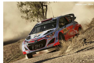
E2 : Sordo seul contre VW.