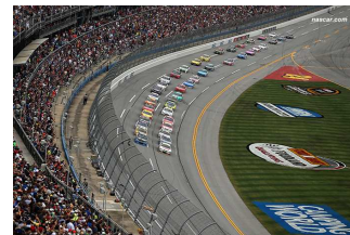
Talladega Superspeedway – Pole pour Jeff Gordon – Start race – Action ...

TALLADEGA : Greg Biffle (47''597) puis Brad Keselowski (48''752) réalisaient les meilleurs chronos des deux séances d'essais qui étaient au programme avant que Jeff Gordon s'adjugeait la pôle en 49''234 devant Kasey Kahne (49''453) et Jimmie Johnson (49''467). Insatiable, Joey Logano aligne sa troisième victoire consécutive des play-offs mais la polémique restera entière car la fin de course gâchée par la dernière neutralisation causée par Kevin Harvick au 195 ème tour sèmera la zizanie et Logano qui précédait Dale Earnhardt Junior de quelques centimètres sera déclaré vainqueur au grand dam des supporters de Dale Earnhardt Junior qui se manifesteront en jetant des canettes de bière sur la piste. Ryan Newman, Matt Kenseth et Denny Hamlin (accident tour 192) se trouvent éliminés tout comme Dale Earnhardt Junior. Restent donc en piste pour la suite des play-offs, Joey Logano, Jeff Gordon, Brad Keselowski, Carl Edwards, Martin Truex Junior, Kurt Busch, Kyle Busch et Kevin Harvick.