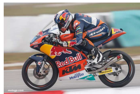
Miguel OLIVEIRA – Red Bull KTM Ajo