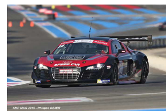
Goujat / Petit

Q2 : Top chrono pour l'Audi R8 LMS Ultra Sébastien Loeb Racing # 3 (Mike Parisy) en 1'25"192 devant la Ferrari 458 Italia Sport Garage # 12 (Enzo Guibbert) en 1'25"255.