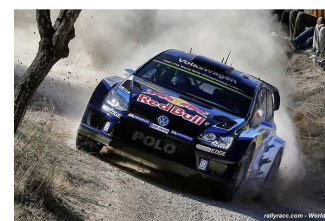
E1 : Ogier / Ingrassia en tête.