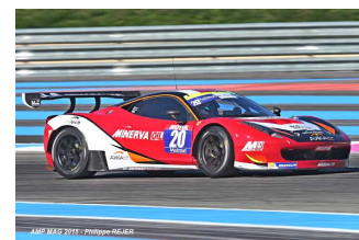
Mastronardi / Beaubelique / M-Traffort