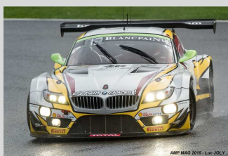
AMP MAG 2015 SPECIAL 008

Sources : wrc.com et rallyracc.com – Photos : rallyracc.com / @World.