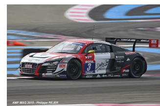
Halliday / Gaillard / Parisy