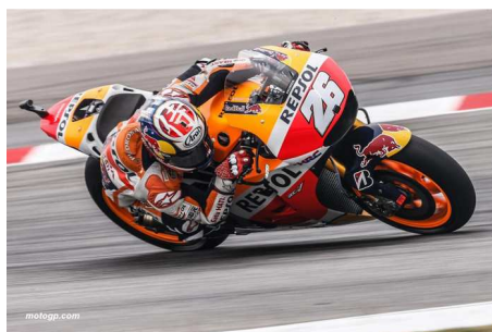
Dani PEDROSA – Repsol HONDA Team