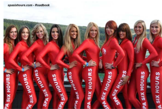
Spa Six Hours Grid Girls*