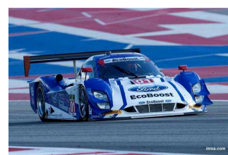
PRUETT / HAND Ganassi Racing Sabates.

Engagés : 38 – Qualifications : 36 – Partants : 36 – Classés : 36 dont 32 en piste à l'arrivée.