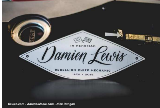
Hommage à Damien Lewis (Rebellion Racing).

Étaient donc en présence les teams Audi Sport Team Joest (Audi R18 e-tron quattro Hybrid # 7 et 8), Toyota Racing (Toyota TS040 Hybrid # 1 et 2), Porsche Team (Porsche 919 Hybrid # 17 et 18), le Rebellion Racing (Rebellion R-One-AER # 12 et 13) et le Team Bykolles (CLM P1/01-AER # 4) en LMP1, G-Drive Racing (Ligier JSP2-Nissan # 26 et 28), Extreme Speed Motorsports (HPD ARX-03b # 30 et 31), OAK Racing (Ligier JSP2-Nissan # 35), Signatech Alpine (Alpine A450b-Nissan # 36), Strakka Racing (Gibson 015S-Nissan # 46), Sard Morand (Morgan Evo-Sard # 43) et KCMG (Oreca 05-Nissan # 47) en LMP2, AF Corse (Ferrari 458 Italia # 51 et 71), Porsche Team Manthey (Porsche 911 RSR # 91 et 92), Aston Martin Racing (Aston Martin Vantage V8 # 95 et 97) et Aston Martin Racing V8 (Aston Martin Vantage V8 # 99) en LMGTE-Pro, AF Corse (Ferrari 458 Italia # 83), SMP Racing (Ferrari 458 Italia # 72), Dempsey Racing Proton (Porsche 911 RSR # 77), Abu Dhabi Proton Racing (Porsche 911 RSR # 88), Aston Martin Racing (Aston Martin Vantage V8 # 96 et 98) et Larbre Compétition (Chevrolet Corvette C7 # 50) en LMGTE-Am. Trois séances d'essais libres suivis par les qualifications étaient au programme des concurrents avant la course de 6 heures du dimanche.