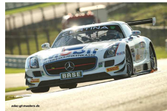
Asch / Ludwig

Engagés : 20 – Q1 : 19 – Q2 : 18 – Partants : R1 : 19 / R2 : 18 – Classés : R1 : 16 / R2 : 15.