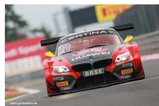
Klingmann / Baumann