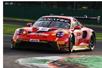
BMW Century Motorsport – McLaren Garage 59 – Aston Martin Comtoy Racing – Porsche Pure Rxcing