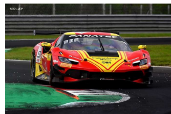
Pole position pour AF Corse

Top Silver : Lamborghini Huracan GT3 EVO 2 GRT Grasser Racing Team # 19 (A. Petrov / M. Llarena / B. Moulin) en 1'45"590.