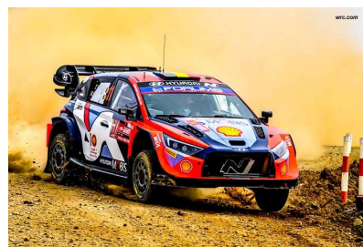
Neuville / Wydaeghe vers le titre