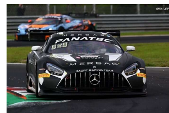
Klingsman / Al Harthy / De Haan – D. Vanthoor / Weerts / S. Van Der Linde – Arrow / Sathienthirakul / Caresani – Beretta / Owega / Maini Bronze Cup – Pro Cup – Silver Cup – Gold Cup

Prochain rendez-vous : BARCELONE (Sprint) du 11 au 13 octobre