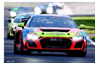
B. Lariche / R. Consani (Silver) T. Lebbon / J. Ratican (Silver)

MONZA Race 2 (Engagés : 51 – Q2 : 48 – Partants : 45 – Classés : 42).