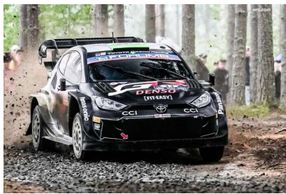
Evans / Martin pénalisés (Mécanique)