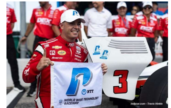
Scott McLaughlin en pole Second de la course

251 à 253 (Contact Rossi, Power, Harvey et Grosjean ligne stand).