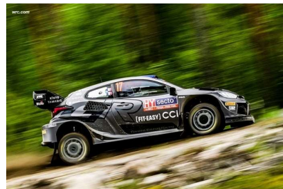
Ogier / Landais vainqueurs