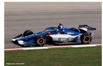
Linus Lunqvist (R) troisième