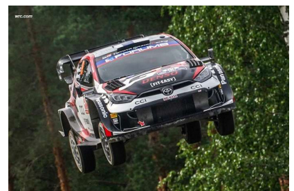
Rovanperä / Halttunen leaders