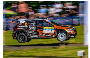
D. Stritesky / J. Hovorka

Prochain rendez-vous : ERC JDS MACHINERY RALI CEREDIGION du 30 août au 1 er septembre