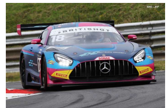
K. Tse / M. Goetz (GT3-PA)

Engagés : 33 – Q2 : 33 – Partants : 32 – DSQ : 2 (# 15 et 17) – Classés : 24.