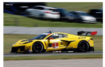
A. Garcia / R. Sims

Prochain rendez-vous MICHELIN PILOT CHALLENGE et WEATHERTECH SPORTSCAR CHAMPIONSHIP ROAD AMERICA du 2 au 4 août