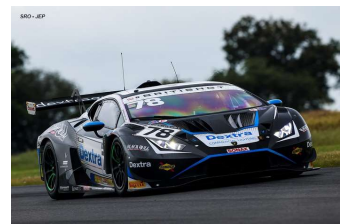
A. Martin / S. Mitchell (GT3-PA) Double victoire

Engagés : 33 – Q1 : 33 – Partants : 32 (Forfait # 77) – DSQ : 2 (# 15 et 17) – Classés : 29.